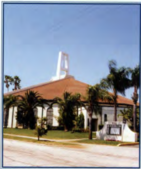
Catedral de la Epifanía (Epiphany).