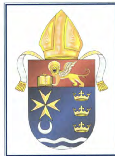
Escudo de Armas de la Diócesis de Venice.

En 1984 cuando la Diócesis de Venice fue creada tenía 39 parroquias, tres misiones, ocho escuelas primarias, un hospital, y 116,495 católicos. En diciembre del año 2004, ya había 54 parroquias, siete misiones, seis capillas, nueve escuelas primarias, y más de 218,000 católicos registrados. Hay dos parroquias de Ritos del Este en la Diócesis de Venice, una