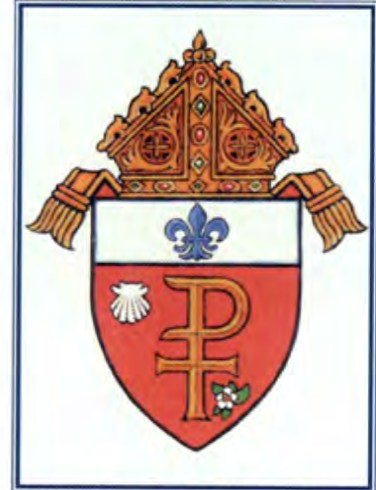
Escudo de Armas de la Diócesis de Orlando.