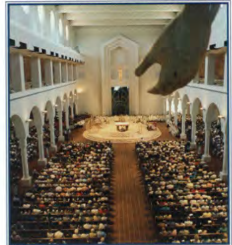
Santuario de María, Reina del Universo.

Como una comunidad próspera y en aumento de fieles católicos, la Diócesis de Orlando tiene por delante un papel cada vez más importante en el trabajo de la Iglesia Universal en la Florida central. El talento y el duro trabajo de su clero, personal, voluntarios y feligreses debe continuar teniendo un impacto positivo y duradero en una región cada vez más importante en el sendero de la historia católica de la Florida.