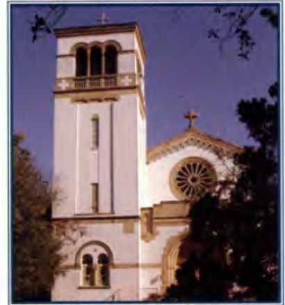
Iglesia de la Abadía de St. Leo.