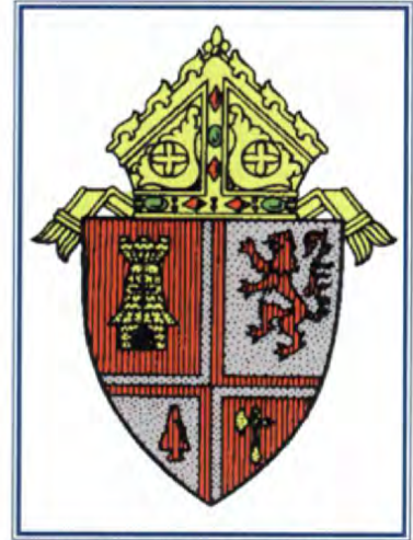
Escudo de Armas de la Diócesis de St. Petersburg.

El 17 de junio de 1968, la Diócesis de St. Petersburg se estableció formalmente, con el Obispo Charles B. McLaughlin como su fundador. La diócesis recién creada se extendía desde Crystal