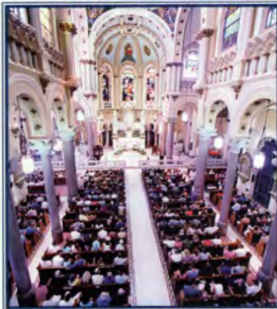
Interior de la Iglesia del Sagrado Corazón, Tampa.