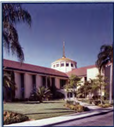
Catedral del Apóstol San Judas.

Visiten www.dioceseofstpete.org para obtener más información